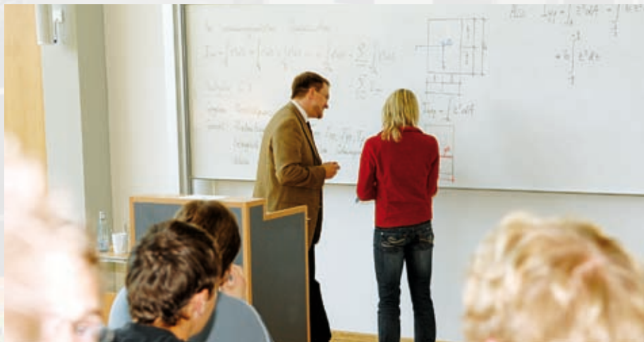
CFK-VALLEY STADE CAMPUS // Das neue Hochschulgebäude steht im Stader Stadtteil Ottenbeck und wurde im Januar 2008 eingeweiht. In unmittelbarer Nähe befinden sich das Airbuswerk und der CFK-Valley Stade e. V., eines der größten europäischen Kompetenznetzwerke für Faserverbundstrukturen.